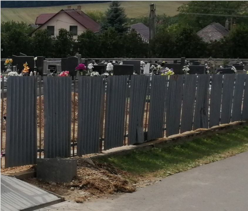
Plot – pôvodný stav