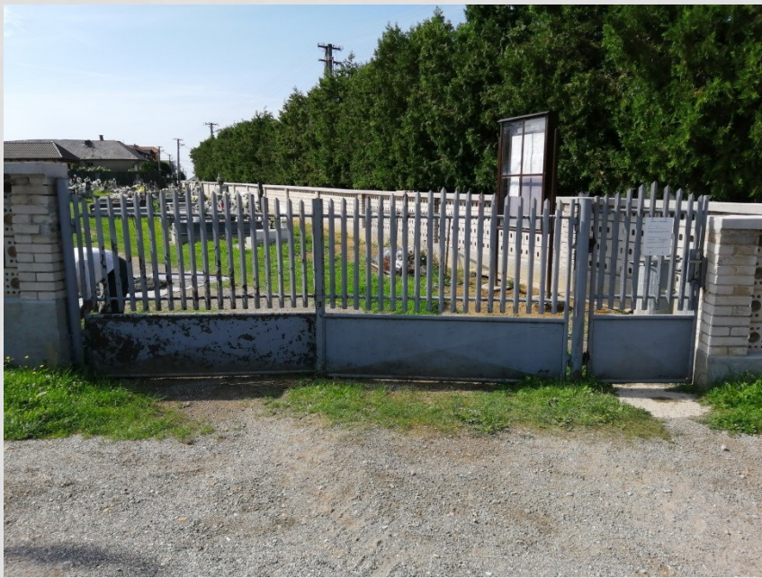
Vstup zvonku pôvodný stav