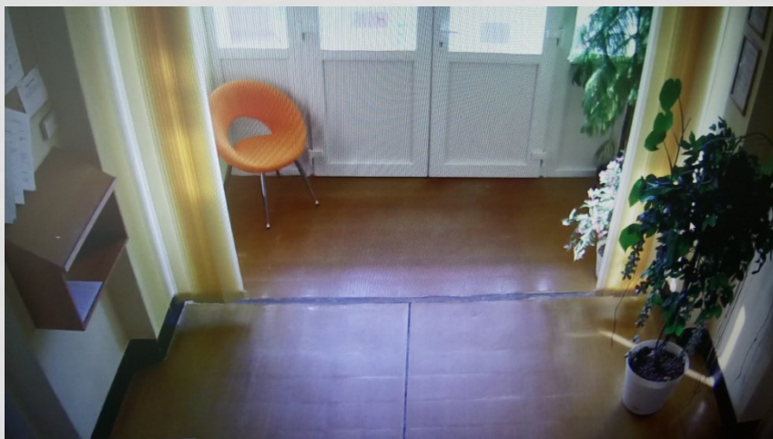
Chodba – pôvodný stav