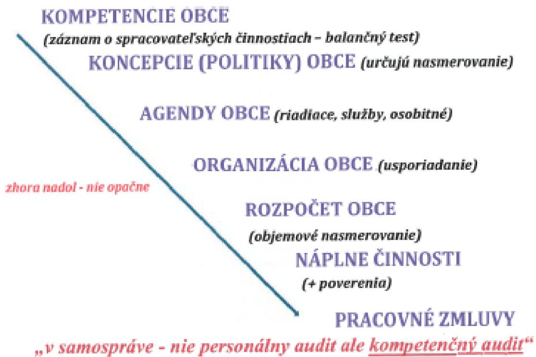
Schéma autor JUDr. Jozef Sotoláč